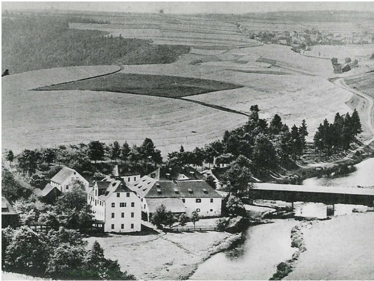
Das Gut Saalbach in den 20er Jahren