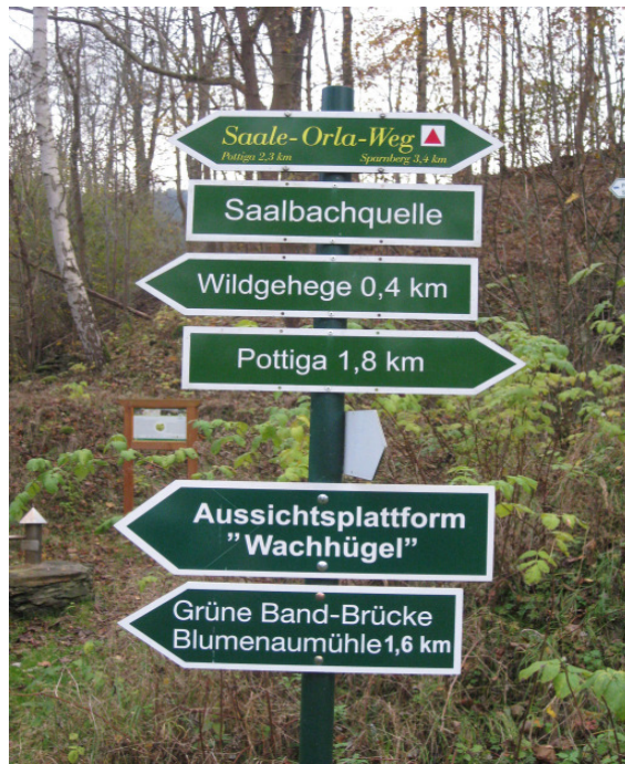
Saalbach als Wandergebiet im „Grünen Band“