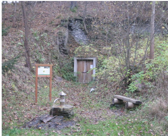
Ruinen von „Gut Saalbach“ im Herbst 2011