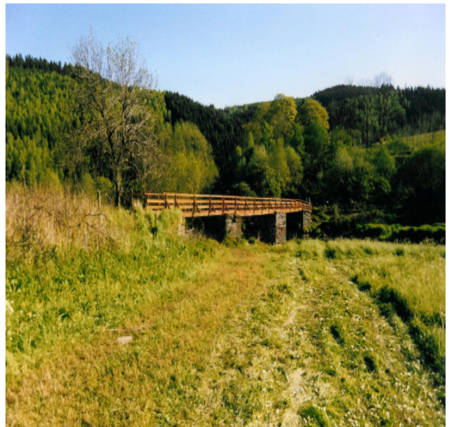
Brückenbau der Holzbrücke 1991