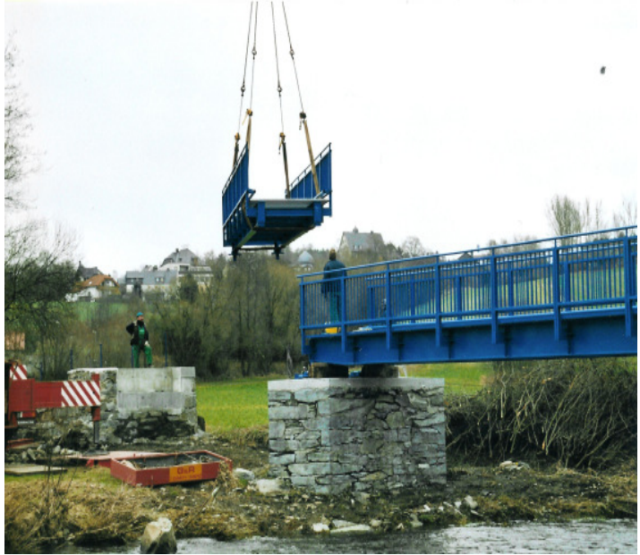
Bau Saalbachbrücke(Blaue Brücke) 1994