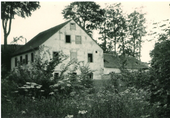
Abriß von „Gut Saalbach 1955-1960