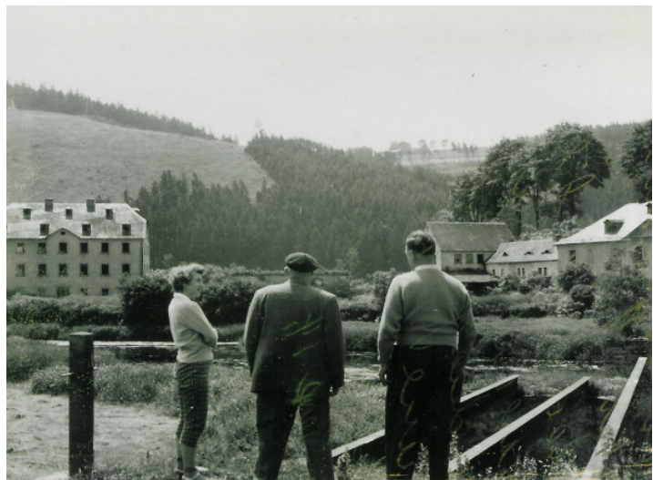
Gut Saalbach- kurz vor dem Abriss