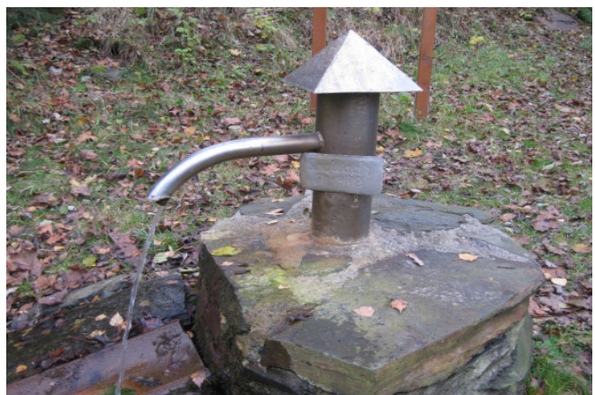
Saalbachquelle um 2005