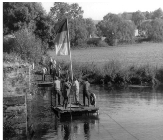
Floßbetrieb zur Wendezeit 1990