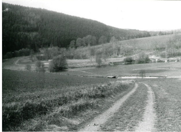
Blick auf das ehemalige Gutsgelände 1989