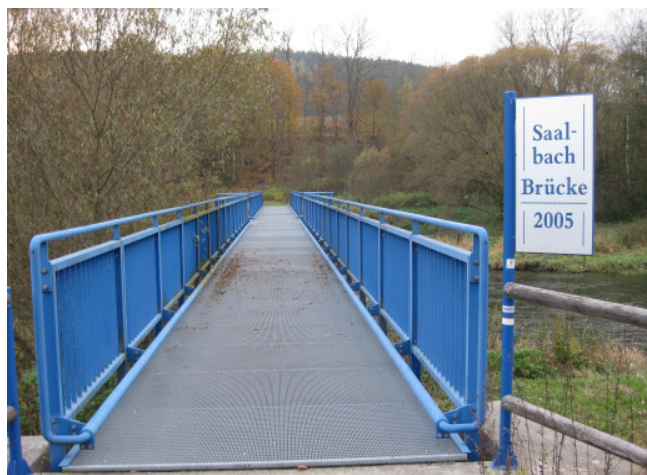
Die Saalbachbrücke im Herbst 2011