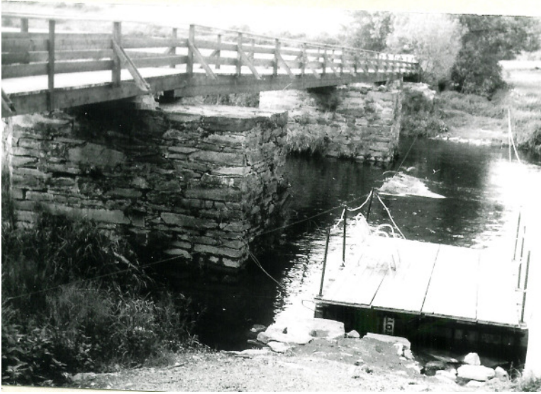
Floß und neue Holzbrücke 1990