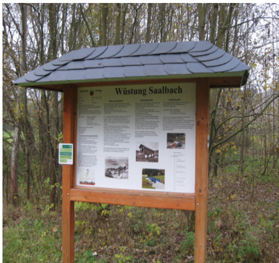
Infotafel „Wüstung Saalbach“