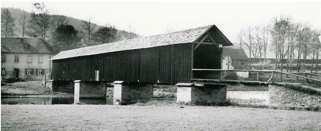
Die überdachte Holzbrücke Anfang der 50er Jahre