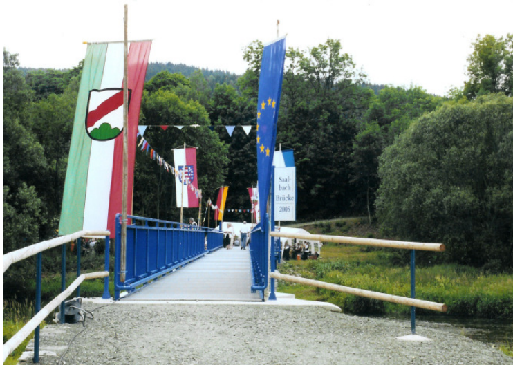
Einweihung der Saalbachbrücke Mai 1995