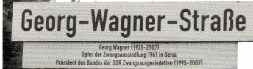
Straßenschild in Geisa